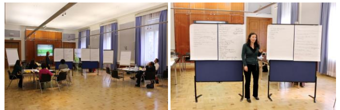
A workshop eredményeinek bemutatása Bécsben