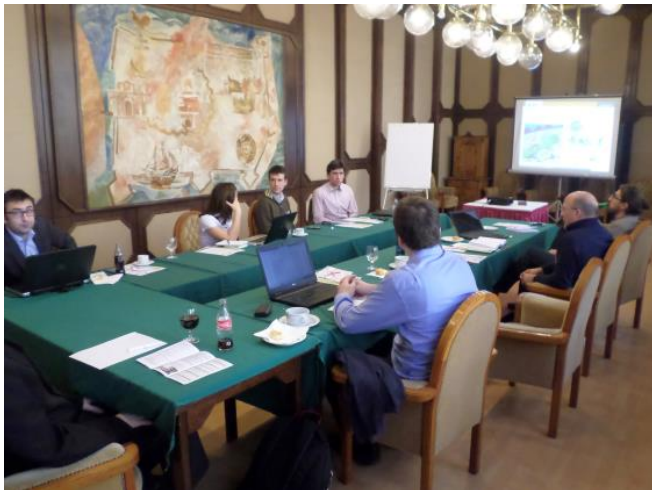
Kerekasztal-beszélgetés a győri EMAH-workshopon

A következő, második szakaszban a kerékpárral ingázó munkavállalókra vonatkozó jogi és anyagi ösztönzőket ismertették az előadók, felhasználva az Ausztriában és Hollandiában működő jó példákat, gyakorlatokat. Ezt követően egy, a workshop témájával foglalkozó szakértői tanulmány került bemutatásra.