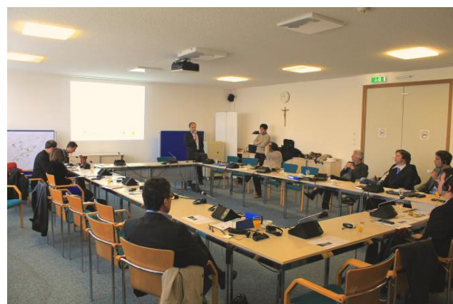
EMAH-csapat az eisenstadti workshopon

Emellett a közelmúltban végrehajtott fókuszcsoportos vizsgálatokat is bemutattuk, összefüggésbe állítva a résztvevő vállalatoknál eddig elvégzett analízisekkel.