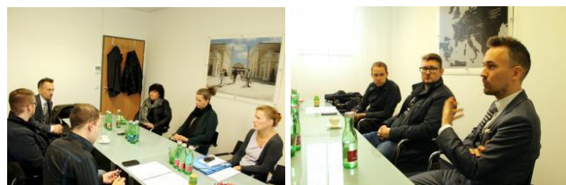
A Designer Outlet Parndorf alkalmazottjai megvitadják mobilitási szokásaikat

Valamennyi interjún érintettünk olyan témákat, mint a telekocsi rendszer (car-pooling), a helyközi közforgalmú közlekedés, az e-mobilitás, az ingázók juttatásai, a munkahelyre történő eljutás ideje, érvek a személygépkocsi használatával/mellőzésével kapcsolatban, de szóba kerültek egyéb közlekedési témák is.