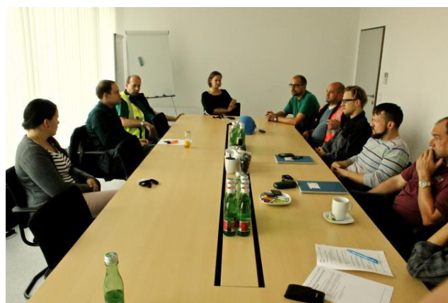
Az ENERCON alkalmazottjai a csoportos megbeszélésen

2014. október 8-án az osztrák környezetvédelmi minisztérium által kezdeményezett Fenntartásügyi Akciónapok keretében egy fókuszcsoportos interjút szerveztünk a burgenlandi Zurndorfban működő ENERCON cégnél. A megbeszélés témája az osztrák-magyar határ régióban zajló munkába járó forgalom volt. 60 perces időkereten belül vitattuk meg a mobilitási és az ingázási szokásokat érintő kérdéseket az ENERCON nyolc alkalmazottjával.