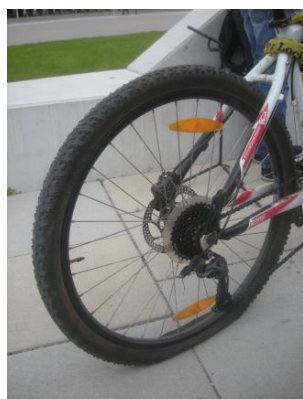
Lapos kerék egy WU-hallgató biciklijén