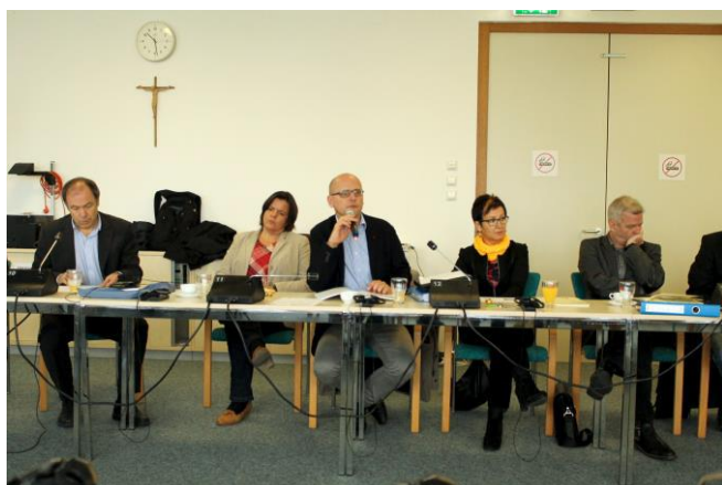
A burgenlandi közlekedési stratégia megvitatása

2014. október 28-án tartottuk a 3. EMAH szakmai találkozót a burgenlandi tartományi kormányzati hivatalban, Eisenstadtban. A meglévő projekt-eredmények, amelyeket az első két szakmai találkozó során már röviden érintettünk, most bővebben is bemutatásra kerültek. Emellett ismertettük az időközben elvégzett munka eredményeit.