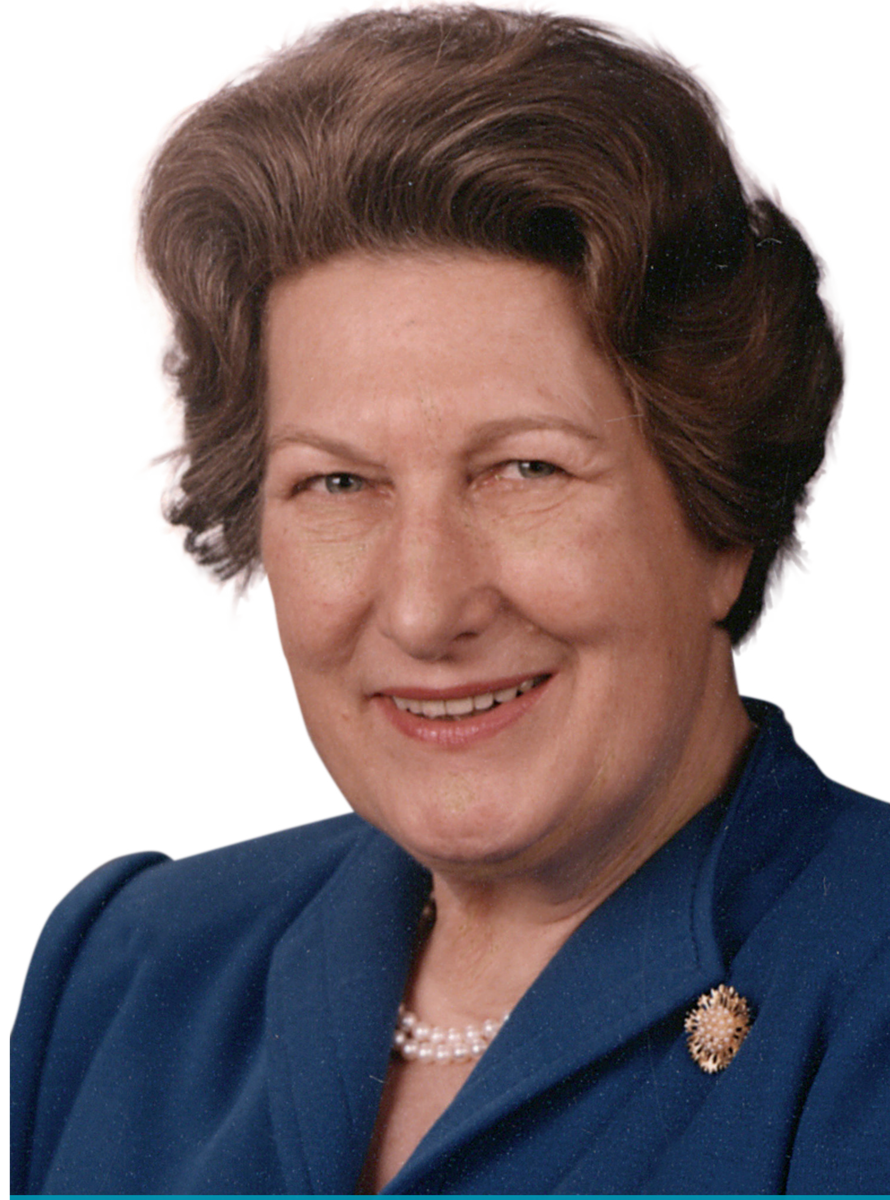
Eine außergewöhnliche Karriere

IHR BERUFSWEG Creditanstalt, amtsführende Stadträtin und Landtagsabgeordnete für die ÖVP, Vorständin der Kommunalkredit, Finanzvorständin der ÖMV.