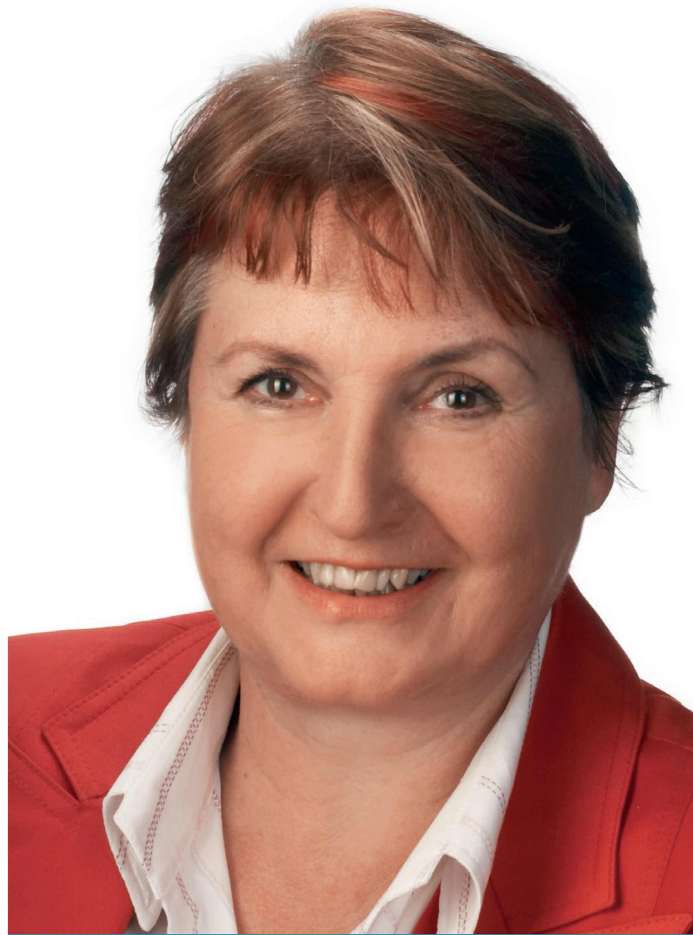
Eine außergewöhnliche Karriere

IHR BERUFSWEG 1968-1972 Lektorin an Universitäten in Japan. Ab 1972 Assistentin an der Hochschule für Welthandel / WU Wien