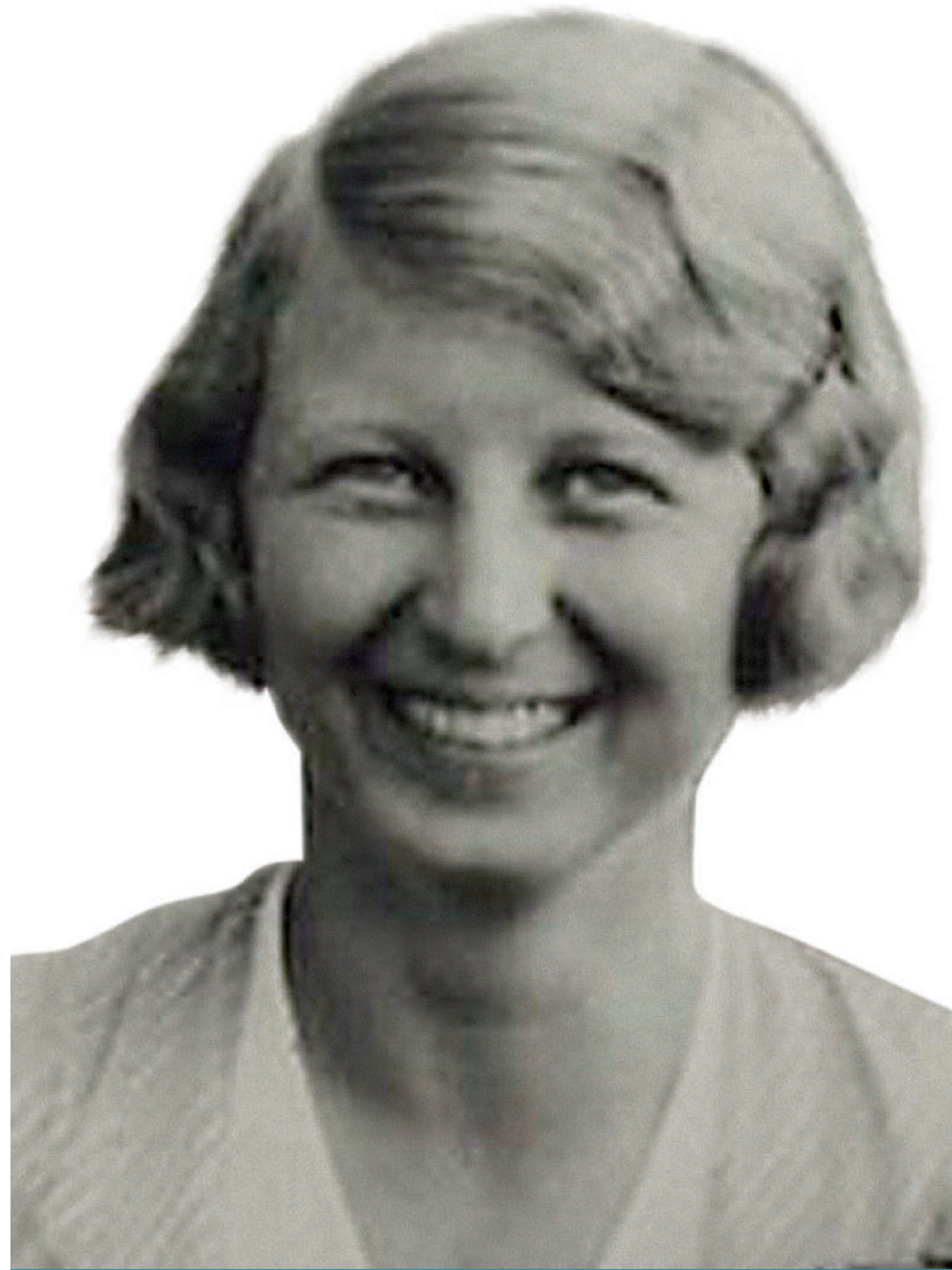
Ein außergewöhnliches Studium