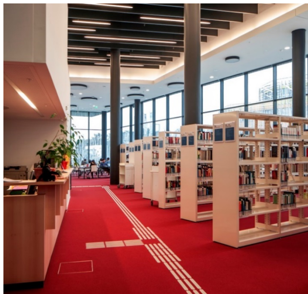
Beispielfoto: Bibliothek Sozialwissenschaften