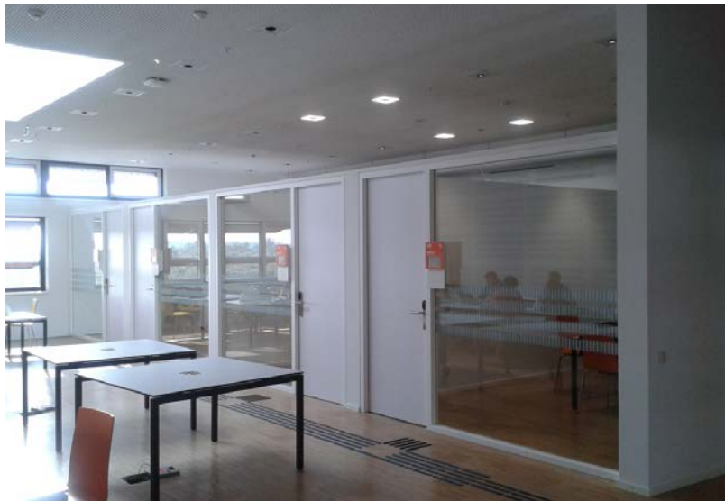
Beispielfoto: 4'er Projektraumeinheit

4 Einheiten zu je 4 Projekträumen für je 8 Personen