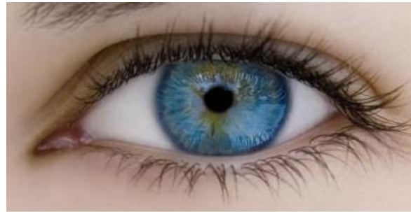
Eigene Kosten vor allem direkte Kosten