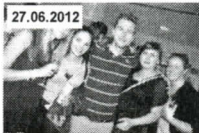
Premiere Uni-Fernsehen PlugIn