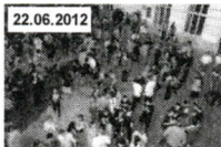
Original TU Hoffest