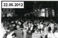
Original TU Hoffest