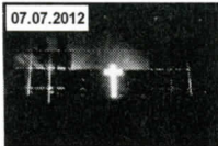
Urban Art Forms Festival 2012